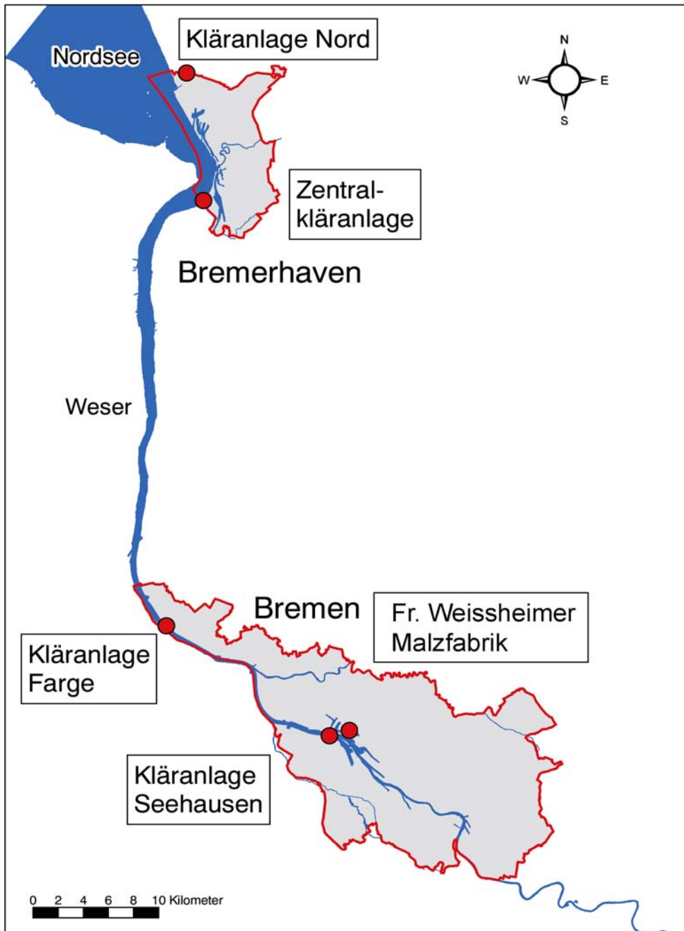
Abbildung 1: Kommunale Kläranlagen und industrielle Einleitungen in Bremen

Daneben unterliegen industrielle Direkteinleitungen verschiedener Bereiche der Nahrungsmittelbranche und verwandter Bereiche der Kommunalabwasserrichtlinie. In Bremen betrifft dieses einen Betrieb der Branche „Mälzerei“.