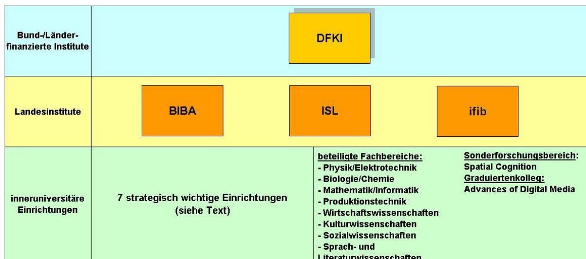
Abb. 3: Wissenschaftliche Einrichtungen im Wissenschaftsschwerpunkt Informations- und Kommunikationswissenschaften

Der Wissenschaftsschwerpunkt Informations- und Kommunikationswissenschaften zeichnet sich sowohl durch seine hervorragenden Leistungen in der Grundlagenforschung als auch durch seine Transferorientierung aus. In der Universität Bremen ist dieser Wissenschaftsschwerpunkt aufgeteilt in die beiden Schwerpunkte „Information - Kognition - Kommunikation“ sowie „Logistik“ (vgl. 3.2.1). IuK und Robotik sowie auch Logistik sind vielfältig vernetzt - von der Grundlagenforschung bis hin zur anwendungsorientierten Forschung. Neben den Hochschulen zählen hierzu sowohl strategisch wichtige außeruniversitäre als auch inneruniversitäre Einrichtungen sowie Forschungsverbünde.