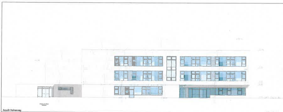
Abbildung 2: Ansicht des geplanten Schulgebäudes vom Halmerweg (Entwurf Alten Architekten) 2

geschossig ausgebildet werden. Dadurch, dass das Schulgebäude und die Sporthalle durch einen nur eingeschossigen Gebäudekörper miteinander verbunden werden, wird zwischen den Hauptbaukörpern eine schmale Fuge ausgebildet. So kann eine städtebaulich vorteilhafte Gliederung der auf der Gemeinbedarfsfläche entstehenden Bau-massen erreicht werden, ohne den Belang des Lärmschutzes zu vernachlässigen.