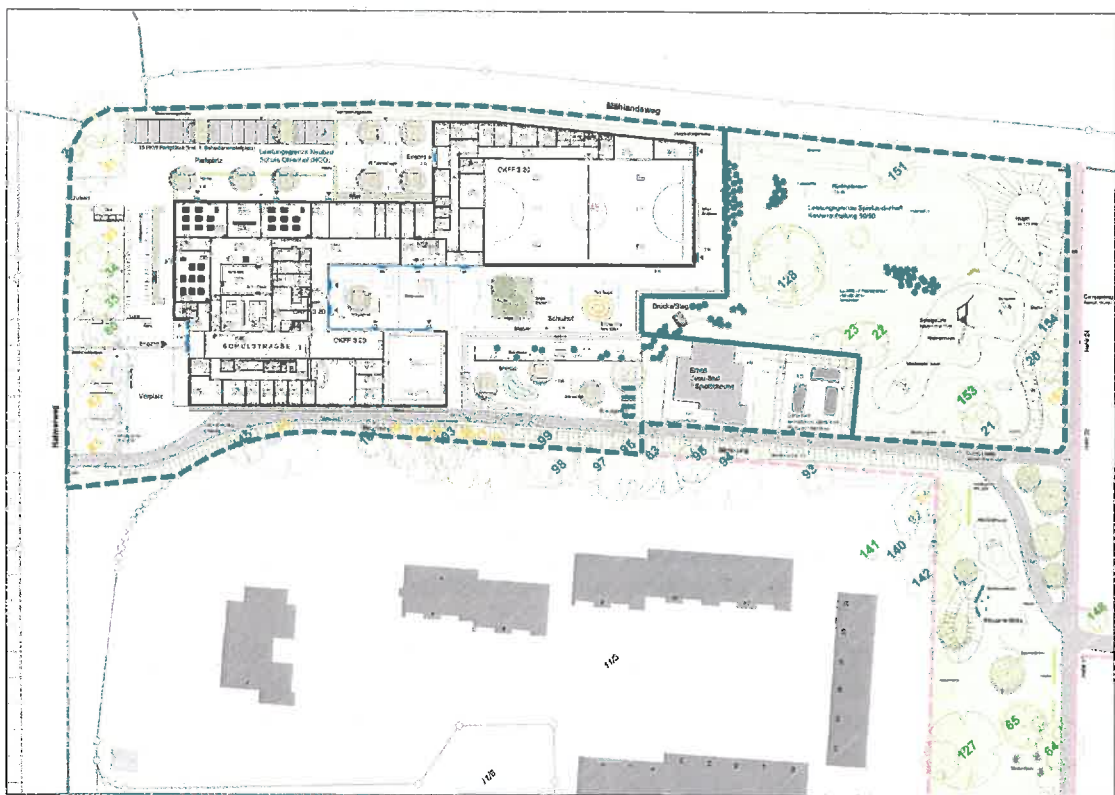
Abbildung 1: Geplanter Schulneubau (Entwurf Alten Architekten) und dessen Freiflächengestaltung (Entwurf Horeis und Blatt)

Das Plangebiet und der hier zu realisierende Neubau der Oberschule Ohlenhof sind Teil dieser Planungen und werden zum Teil mit Mitteln der Städtebauförderung gefördert. Perspektivisch soll – wie im o.g. Wettbewerb auch behandelt – außerhalb des Plangebietes noch ein Mensagebäude im Bereich des jetzigen Gemeinschaftshauses den Campus Ohlenhof abrunden.