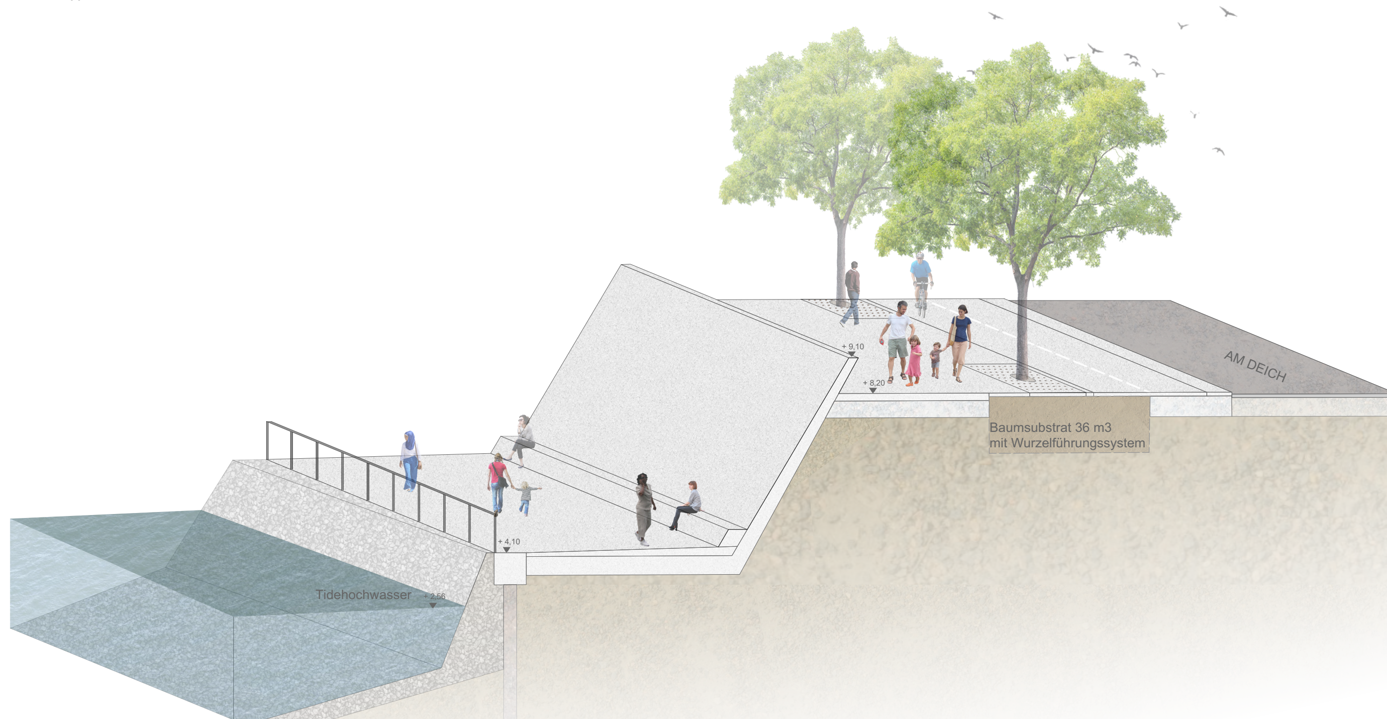
AXONOMETRIE AM DEICH AN DER BÜRGERMEISTER-SMIDT-BRÜCKE M 1:100