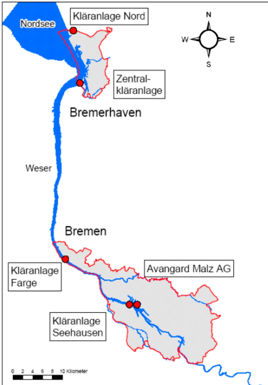
Abbildung 1: Kommunale Kläranlagen und industrielle Einleitungen in Bremen

Daneben unterliegen industrielle Direkteinleitungen verschiedener Bereiche der Nahrungsmittelbranche und verwandter Bereiche der Kommunalabwasserrichtlinie. In Bremen betrifft dieses einen Betrieb der Branche „Mälzerei“.